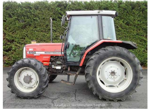
Un tracteur pour Diaranguel

Le village de Diaranguel ne pourra accéder de façon pérenne, à l'autosuffisance alimentaire que dans la mesure où il sera capable d'augmenter les tonnages de production de riz, maïs, mil etc... soit en augmentant les rendements, soit en cultivant de plus grandes surfaces.